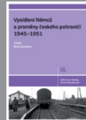
Díl III. 1946: Rok transferu