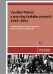
Díl V. Výsledky migrací Situace menšin Kulturně společenské poměry