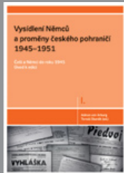
Díl I. Češi a Němci do roku 1945 Úvod k edici