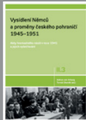
Díl II.3 Akty hromadného násilí v roce 1945 a jejich vyšetřování