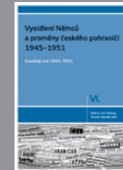
Díl VI. Soudobý tisk 1945–1951