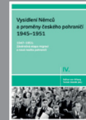
Díl IV. 1947–1951: Závěrečná etapa migrací a nová realita pohraničí