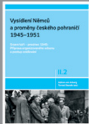
Díl II.2 Srpen/září – prosinec 1945: Příprava organizovaného odsunu a postup osídlování