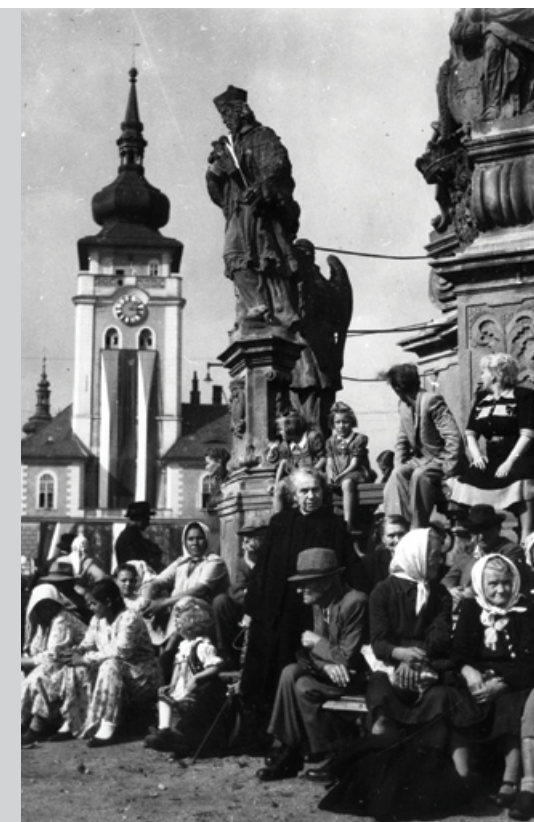
Photo: Regionální muzeum KA, Polánka v Zátci (Reemigrantina náměstí v Zátci, 1949).